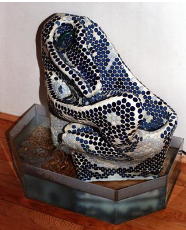
"HAUSBRUNNEN 1", Stahlbeton, keramische Fliesen, Pumpe, Filter, Glas, Silikon 55x80x80cm, 1991, Unikat