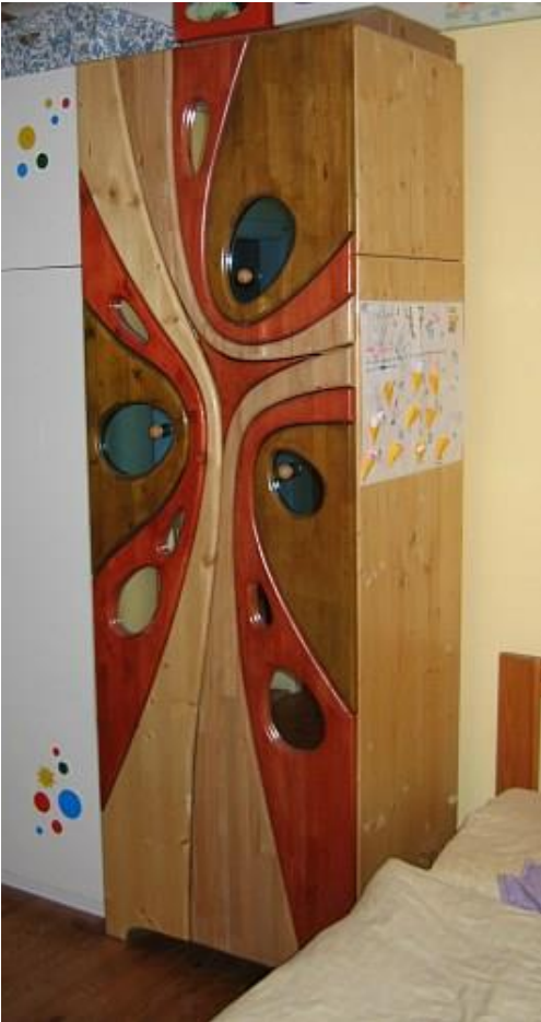
Kleiderschrank "B253"; Fichte, Buche, Kiefer, teilweise gebeizt, verschiedenfärbige Gläser H=225cm