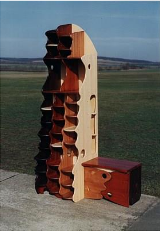
Schuhkasten, Holz, gebeizt H=215cm