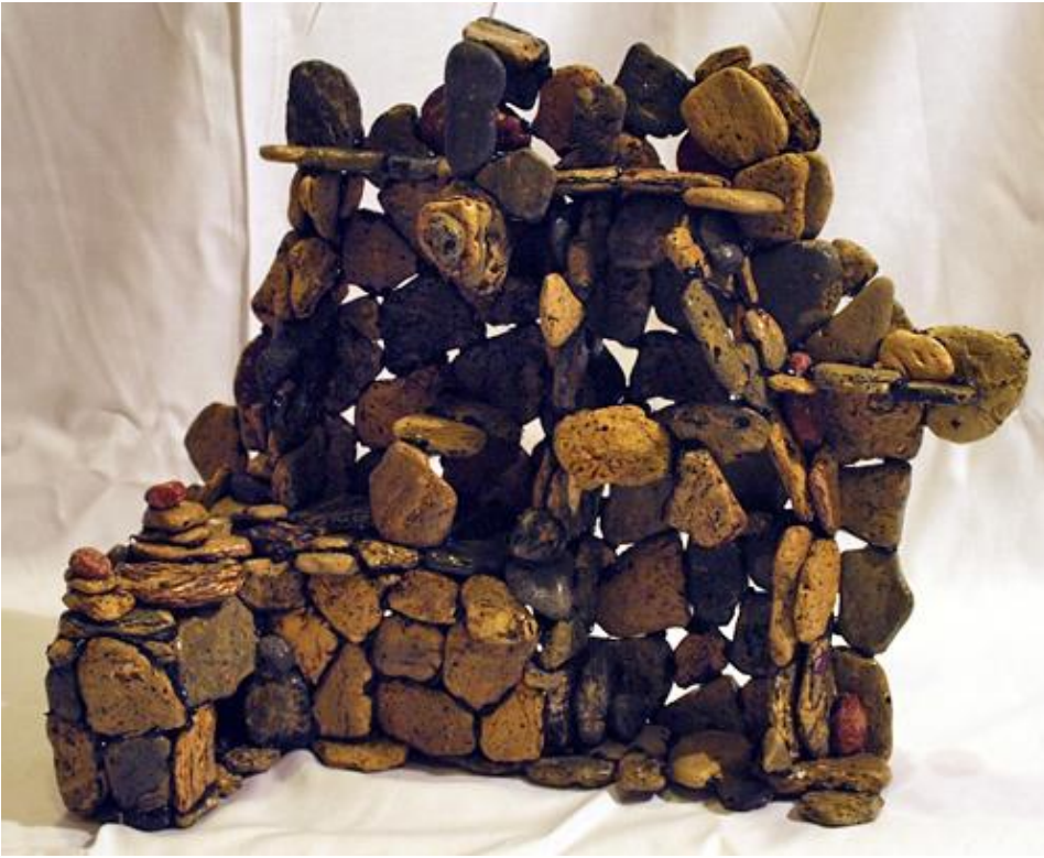
"Fischgarage 2", für Aquarium, Vulkangestein verklebt 20x40x45 cm; 25.-30.11.2010; Unikat