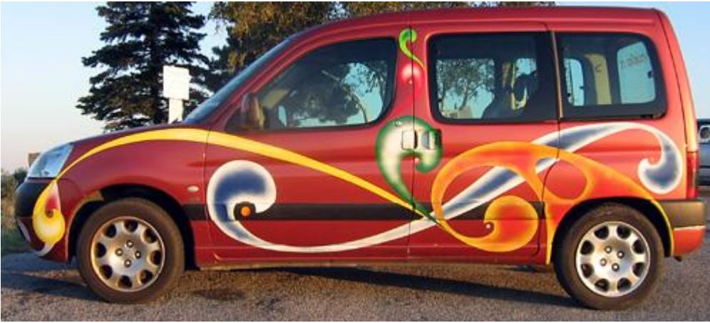
Fahrzeug des Künstlers, Acryl, 2008