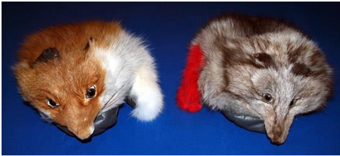
"Fellbesetzte Fäustlinge", Fuchsfelle, teilweise gefärbt

Länge: je 30cm; 10.11-10.12.2011; Unikat >> Dank an Hrn. FIGURA für die plangenaue Fertigung!