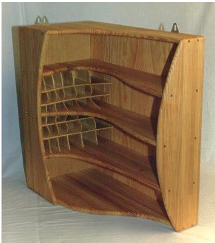
Regal für Bad, Holz H=65cm