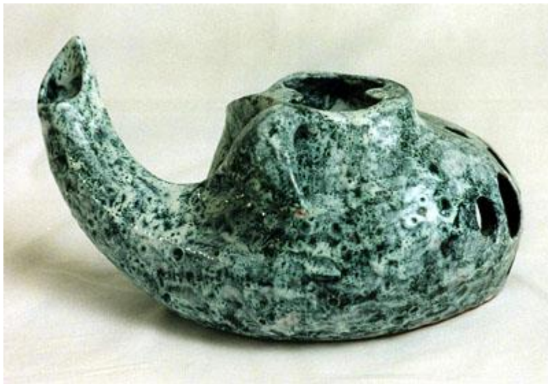
"TEEKANNE", weiß und schwarz glasierte Keramik 1986, Unikat