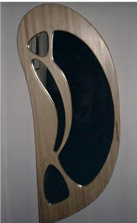
Spiegel, Holz & Glas H=135cm