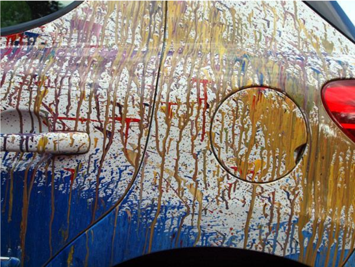
Vier Fotos des Peugeot 207 des Künstlers 16.08.-18.08.2013, Acryl