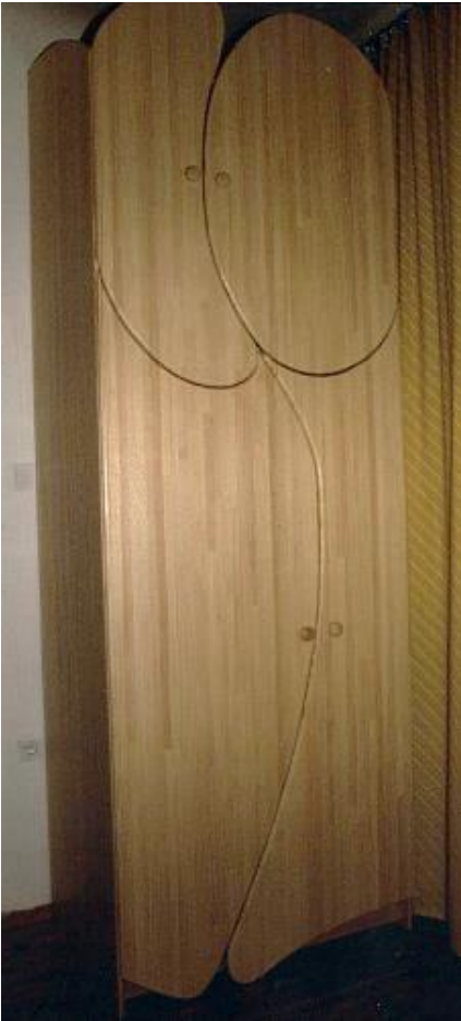
Kleiderkasten, Holz H=240cm