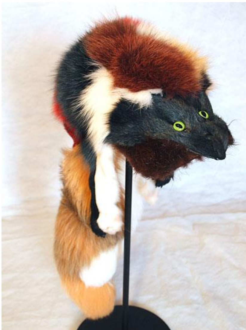
Schamanische Fellhaube, versch. Fellreste, Kunststoffaugen (Vorder- und Rückseite) 80cm lang; Februar 2011; Unikat >> Dank an Marion L. für die plangenaue Fertigung!

Länge: je 30cm; 10.11-10.12.2011; Unikat >> Dank an Hrn. FIGURA für die plangenaue Fertigung!