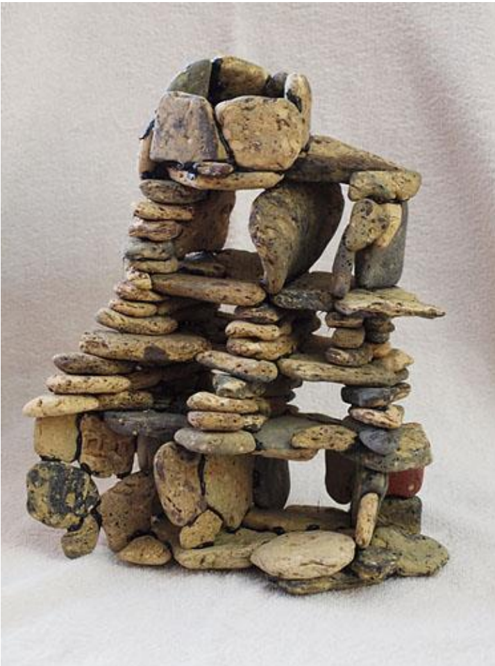
"Fischgarage 1", für Aquarium, Vulkangestein verklebt 20x20x35cm; 10.-15.11.2010; Unikat