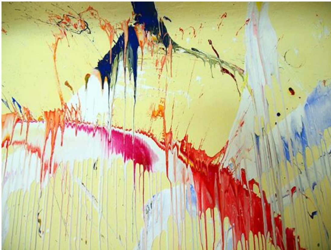
Vier Detailfotos der vom Künstler gestalteten Decken und Wände seines Ateliers (2004)