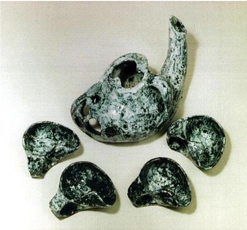
"TEESERVICE", 5-teilig, weiss und schwarz glasierte Keramik 1986, Unikat