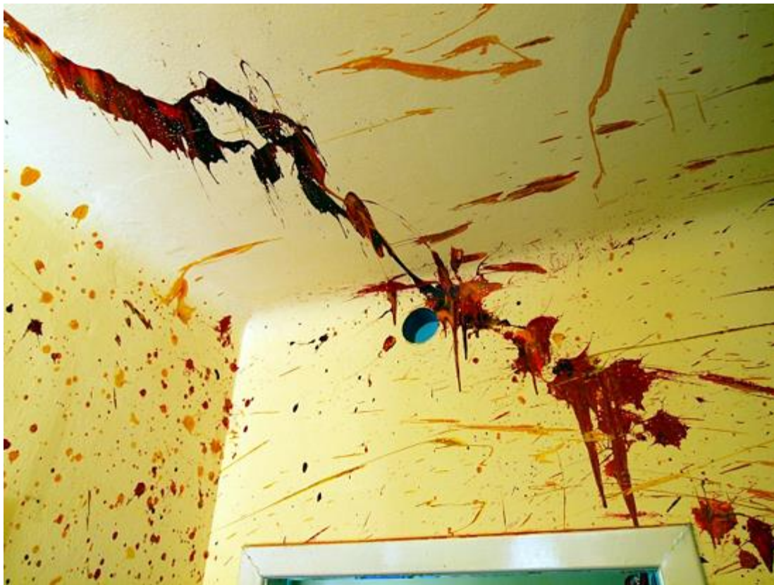
Zwei Detailfotos einiger vom Künstler gestalteten Decken und Wände seines Appartements (2008)