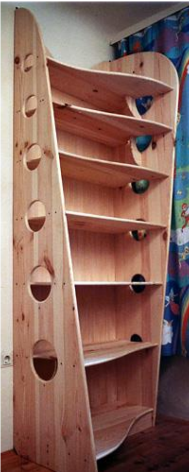
"BÜCHERREGAL-SCHRÄG", Kiefer, Zirbelkiefer, Acryllack 61x87x250cm, 1991, Unikat