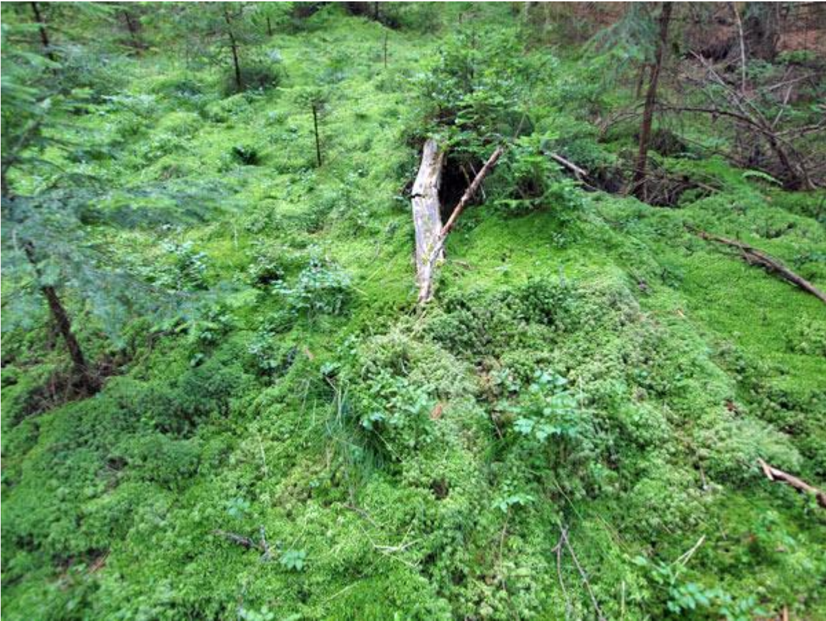
Drei Fotos des Eibensee bei Fuschl im Salzkammergut vom 02. August 2012: